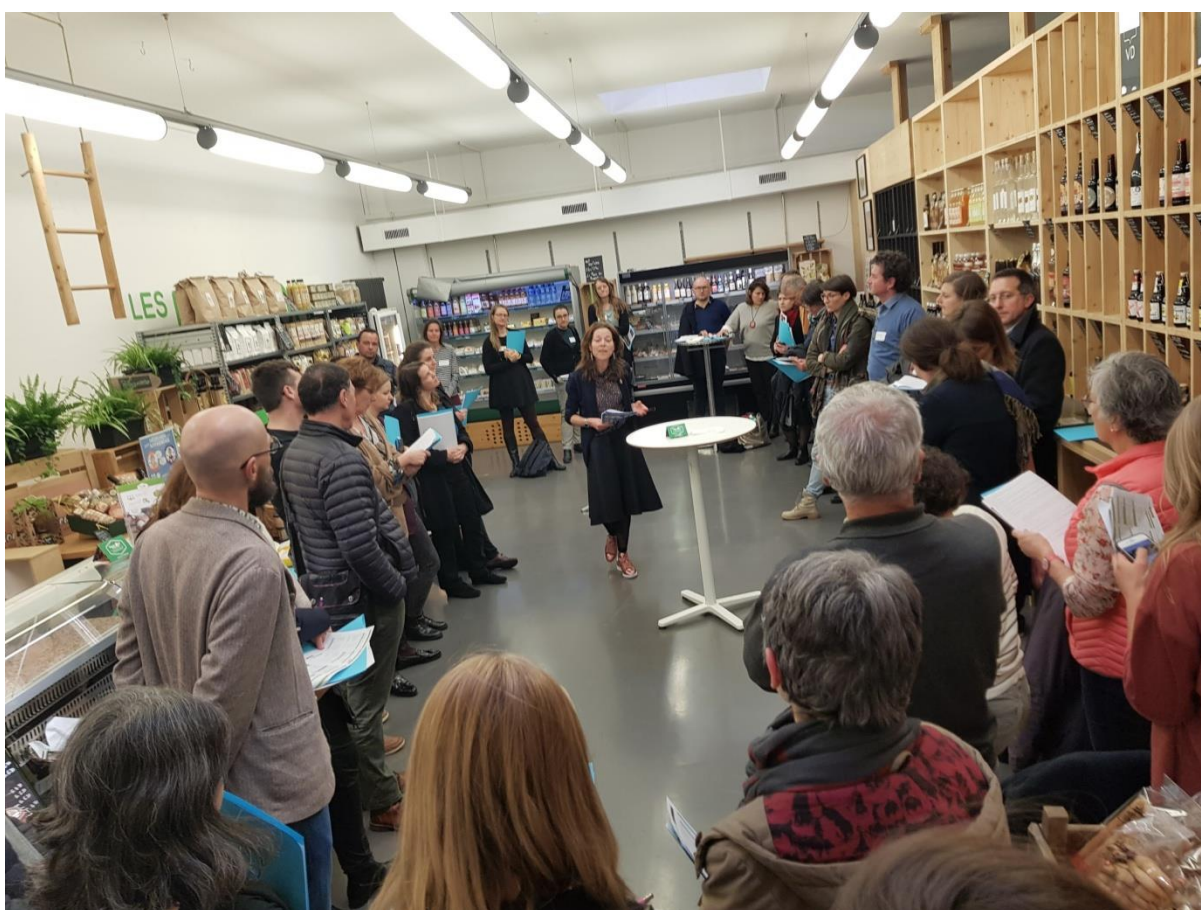
Photographie : Assemblée générale de Coord21, 10 mars 2020, Lausanne